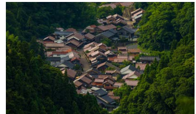
仙ノ山展望台から眺める大森町(石見銀山)

旅行代金に含まれるもの：上記旅程記載の貸切タクシー代・拝観料・食事代金 旅行代金に含まれていないもの：上記旅程以外に行動される場合の費用・個人的性格の諸費用・保険代