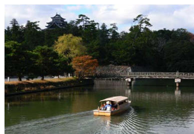
堀川遊覧船(松江城)